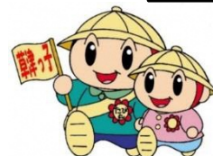
草津市公認マスコット キャラクター たび丸