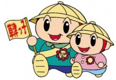
草津市公認マスコットキャラクター たび丸

子どもたちが健やかに育つとともに、地域からも親しまれるこども園となることを願い、新しい園名を募集します。