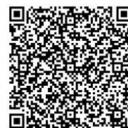
パソコン・スマートフォン

https://s-kantan.com/city-kusatsu-k/offer/offerListMobile_detail.action?tempSeq=321