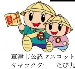
草津市公認マスコット キャラクター たび丸