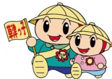
草津市公認マスコットキャラクター たび丸

子どもたちが健やかに育つとともに、地域からも親しまれるこども園となることを願い、新しい園名を募集します。