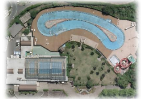
現在のロクハ公園プール