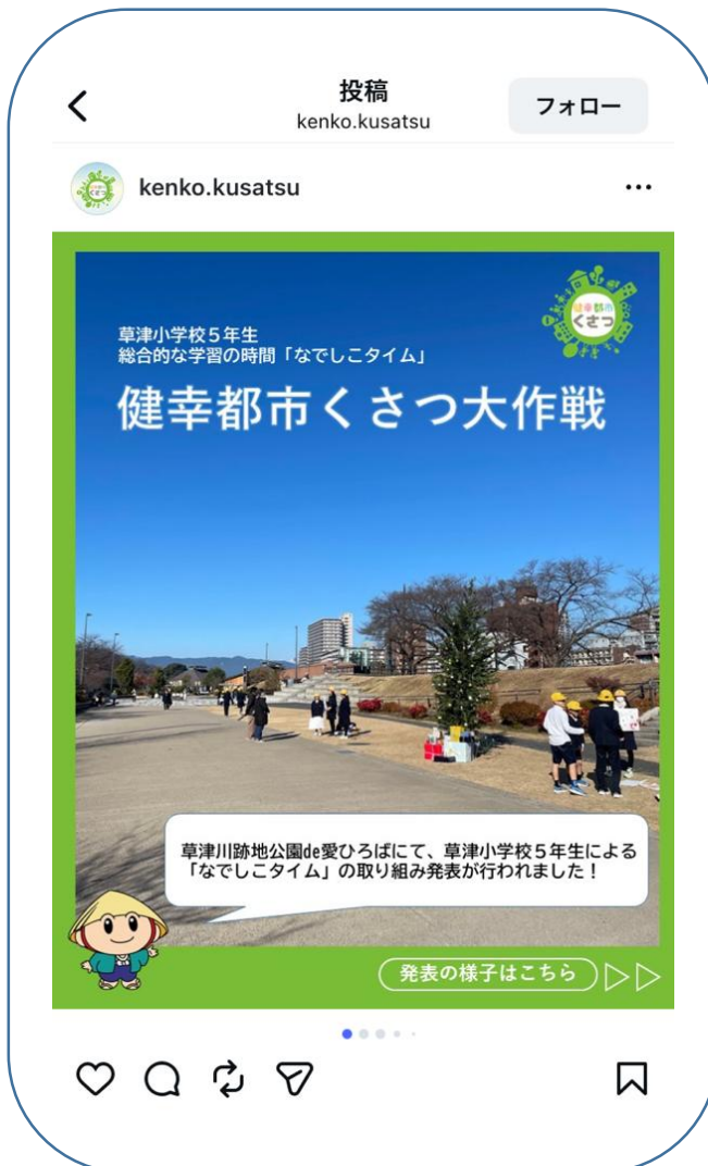
↑ 健幸都市くさつ公式Instagramにも発表の様子を投稿しています！