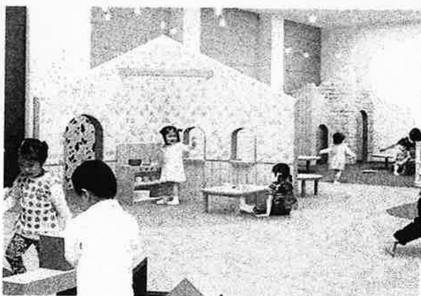
施設内イメージ図

より多くの子どもと保護者の交流や子育て相談、子育てに関する情報提供・発信などを充実させることで、保護者の子育てへの不安解消を図ります。