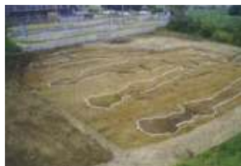
国史跡野路小野山製鉄遺跡 (製鉄炉)

このように、本市の地形や水系など、自然環境に調和した草津では、弥生時代以降、時代に応じて様々なものづくりが行われました。特に古代には、瀬田丘陵周辺で大規模な製鉄・鑄造を中心とした火を使ったものづくりが行われており、当時の都との関わりをうかがうことができます。