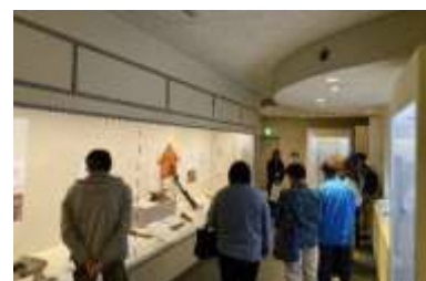
市の歴史を伝える企画展