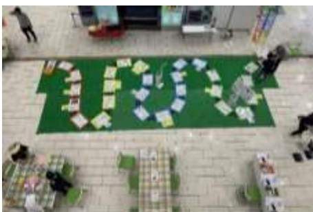
商業施設でのイベント

歴史文化の価値や魅力と出会うきっかけとなるよう、幅広い世代に対して積極的な情報の共有・発信を推進します。