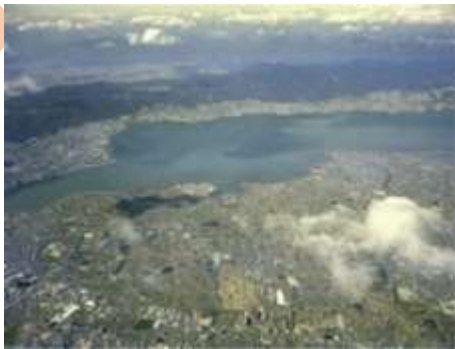
上空から見た草津