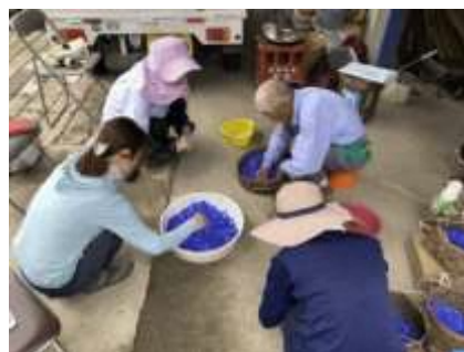
青花紙担い手セミナー