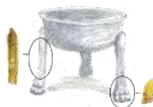
榊差遺跡出土獣脚鑄型と復元イメージ図