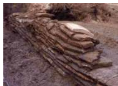
宝光寺跡 瓦積基壇