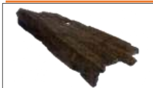
中沢遺跡出土 和琴

烏丸崎遺跡などから製品とともに未成品が出土することや、柳遺跡や中沢遺跡などから木製の鋤鍬とともに未成品の木製農工具が出土することから、本市のものづくり文化は、弥生時代から古墳時代にかけての玉つくりや木製品の加工に始まったことが分かっています。