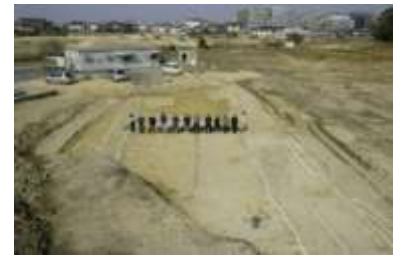
榊差遺跡 推定東山道

このように、本市は古代から交通の要衝として知られ、陸上交通と琵琶湖を介した湖上交通の集積地となり、人と物が行き交う地としてその名を広めました。本市は、現在でも京阪神のベッドタウンとして発展しており、交通の要衝であるという歴史性は連綿と引き継がれています