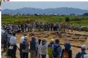
発掘調査成果報告会