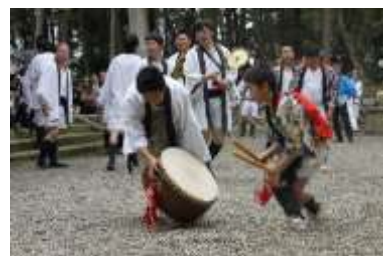
草津のサンヤレ踊り(片岡)