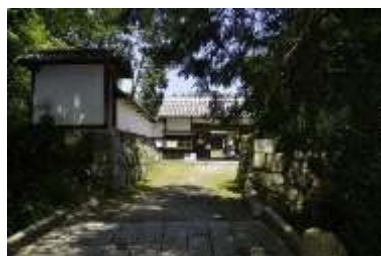
国史跡芦浦観音寺跡

このように、寺社などの建造物や、地域に受け継がれる風習や民俗芸能は、現在まで大切に守り伝えられるとともに、発掘調査によって古代からの人々の祈りの姿を見ることができるとともに、遺構や遺物が確認されています。