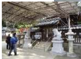
防火訓練・防火点検