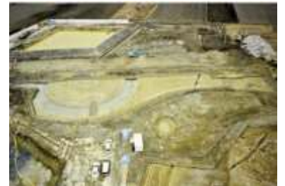
狭間遺跡 埋没古墳

市域中部では、近世に東海道と中山道が分岐・合流する交通の要衝として宿場町草津が発展をみせ、国史跡草津宿本陣をはじめとして、姥ヶ餅などの名物や各地に建てられた道標が残されています。