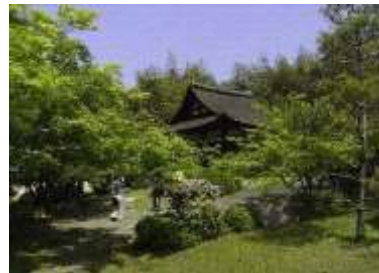
重要文化財観音寺阿弥陀堂 (芦浦観音寺)