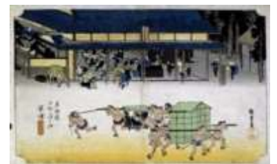
歌川広重画 「東海道五拾三次之内草津」