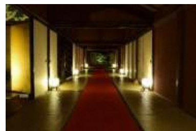
史跡草津宿本陣「草津街あかり」