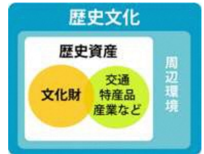
歴史文化・歴史資産・ 文化財の関係図

本計画では、指定・未指定に関わらず文化財そのものと、それに伴う交通や特産品、その地域の産業など、文化財に付随する要素を含んだ概念を「歴史資産」とし、「歴史資産」の周辺の地域や所有者や保存団体などの周辺環境全体を含んだ概念を「歴史文化」と定義し、区別します。