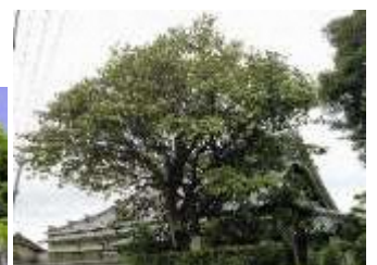
市指定天然記念物 最勝寺のツバキ(熊谷)