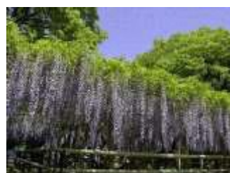
市指定天然記念物 三大神社のフジ

本市には1,287種の植物の生育が確認されています。そのうち草本類が最も多く、309種を占めます。その中には、歴史文化の形成に影響を及ぼした植物も含まれており、その中には2件の市指定天然記念物が含まれています。