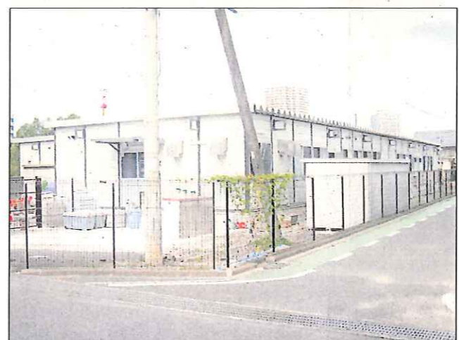
仮設幼稚園舎イメージ