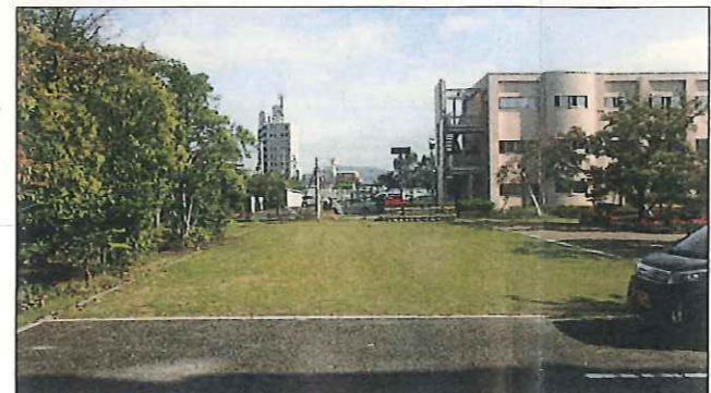
仮設幼稚園舎建設予定地