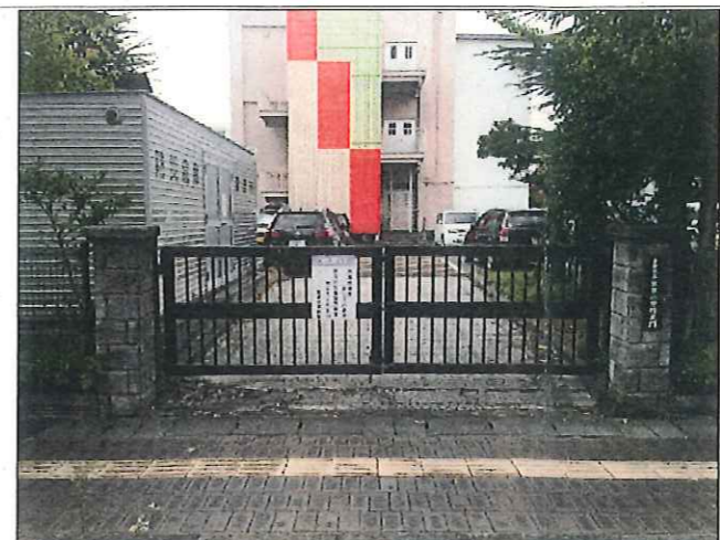
仮設幼稚園舎用出入口