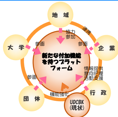
図4 推進体制の構築イメージ図

今後は、推進体制やプロジェクトの進捗状況を把握していくとともに、社会情勢や南草津エリアの変化に対応し、概ね本ビジョンの中間年次となる5年程度を基本としたPDCAサイクルを取り入れ、ビジョンの見直しを検討していきます。