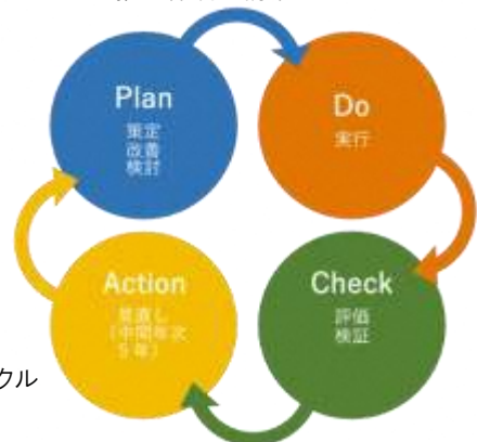
図5 PDCA サイクル