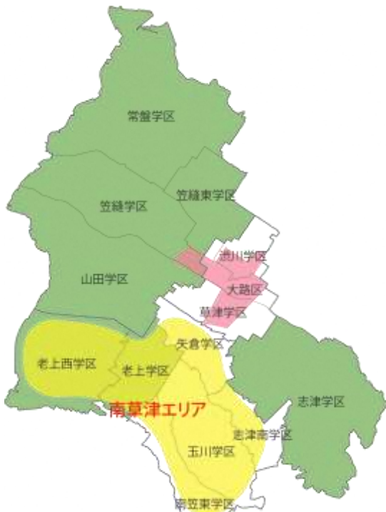
図1 ビジョンの対象エリア

本ビジョンは、JR南草津駅周辺とその周辺の地域も含めたエリア(志津南、矢倉、老上、老上西、玉川、南笠東学区)を「南草津エリア」と位置付け、対象エリアとします。