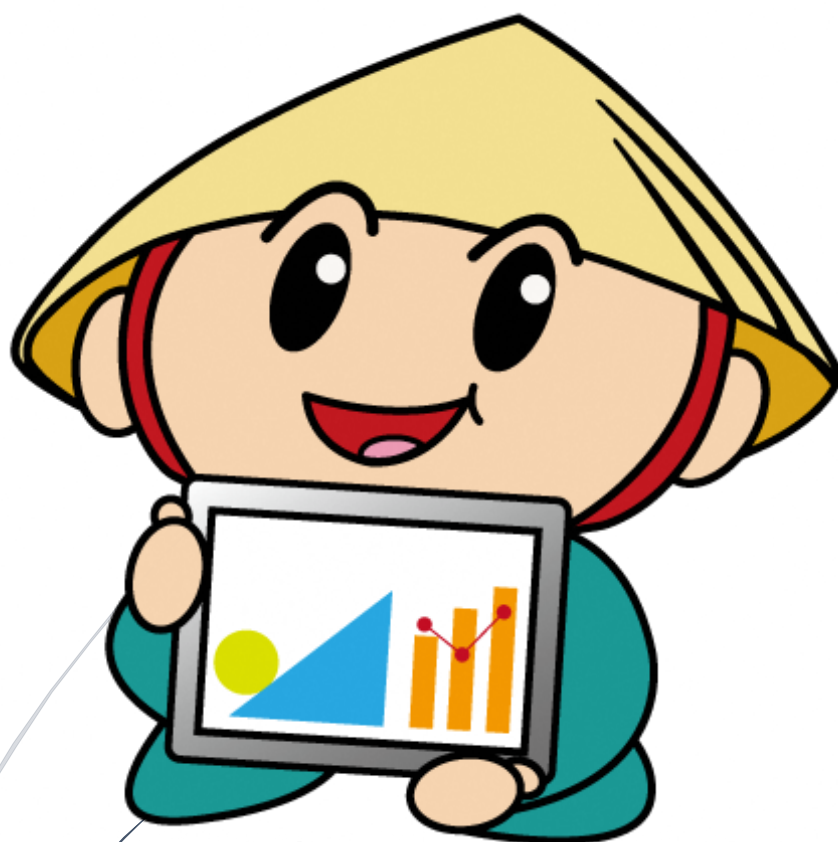
草津市公認マスコット「たび丸」