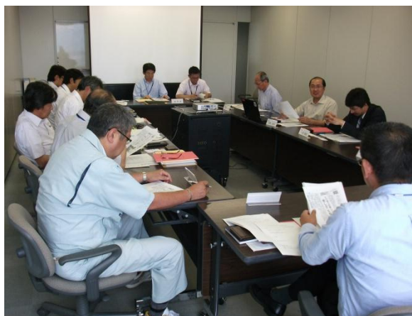
6次産業化に関する研究会