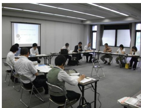
草津市の医療福祉のあり方研究会