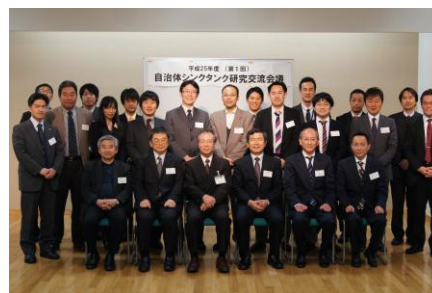
第1回自治体シンクタンク研究交流会議