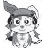
▲行政相談のマスコット 滋賀ご当地キーン「びわんこ」