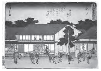
夕暮れ～旅人の旅籠屋入り(歌川広重画「東海道五拾三次水口」草津市蔵)

📅 10月14日(土)～11月26日(日) 9:00～17:00(入館は16:30まで) 料 入館料要