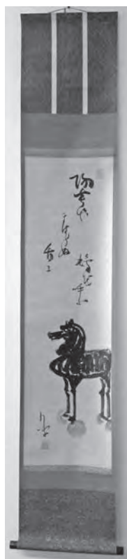
▲ 巖谷小波「黒駒図」(草津市蔵・中神コレクション)

千支にまつわる掛軸 巖谷小波「黒駒図」(草津市蔵・中神コレクション) No.218