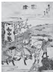
◀ 葛飾北斎 「東海道五十三次 草津」 (草津市蔵・中神 コレクション)