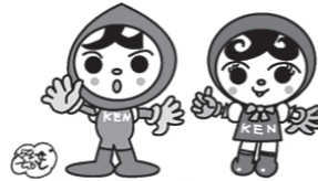
人権イメージキャラクター 人KENまもる君(左) 人KENあゆみちゃん(右)