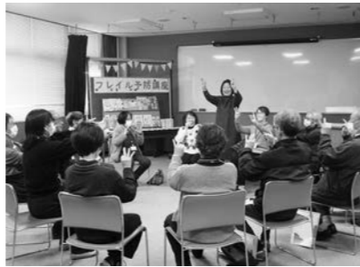
▲フレイル予防講座

草津市読書のまち推進計画に基づき、高齢者の生きがいづくりや健康な生活を支援しています。生涯にわたる学びや他者との交流のきっかけになるよう、読書活動を支援しています。高齢者向けの講座や企画を通して、図書館へ来館してもらい、読書による生涯学習を推進していきます。