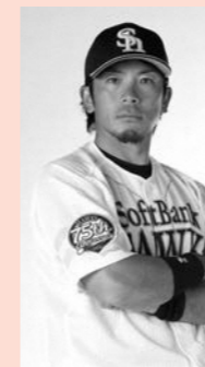
プロ野球選手 松田 宣浩

質問① 健幸について気をつけていること 質問② 健幸でいるためのワンポイントアドバイス