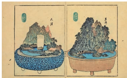
▲木村唐船・作 歌川芳重・画「東海道五十三次鉢山図会」(部分)(草津市蔵・うばがもちやコレクション)

こちらが7月16日(土)から草津宿街道交流館で開催する夏季テーマ展「うばがもちやさんが集めた街道と旅の資料たち」で展示します。ぜひご覧ください(詳しくは、18ページをご覧ください)。