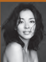
Domani2014年1月号掲載 撮影/Lealie Kee

車は電気自動車に、買い物にはエコバッグを、出かける際にはマイボトルを持つように心掛けています。洗剤類は詰め替えパックを利用したり、できるだけ余計な買い物はしないようになど、身近な日常生活の中で簡単に取り組めることを継続しています。