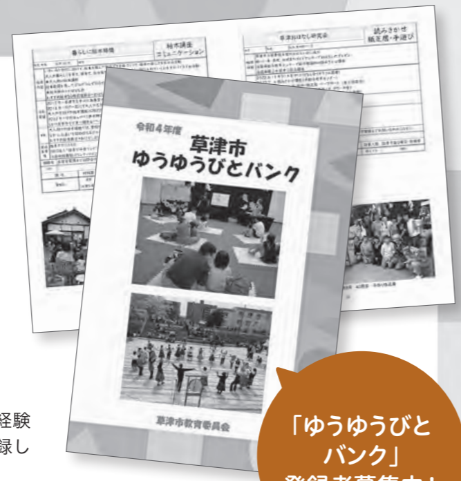
▲現在約70の個人・団体が登録の「ゆうゆうびとバンク」冊子

『ゆうゆうびとバンク』は、さまざまな知識や技術・経験を社会で生かしたいという個人やグループ、団体を登録している学習ボランティア活動の人材バンクです ●自分の知識や経験、技術を市民の皆さんに提供したい ●免許や資格は無いけど、得意なことを教えたい などボランティア活動を希望する人の登録をお待ちしています。