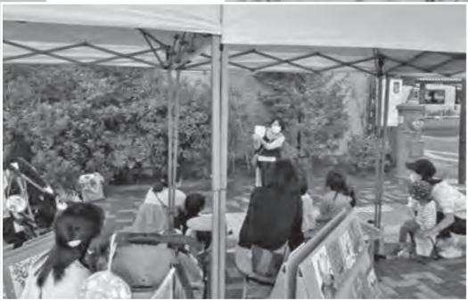
▲ゆめほんDAYでのおはなし会のようす