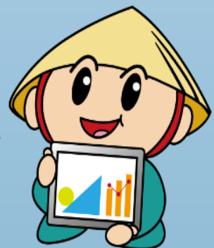
草津市公認マスコットキャラクター 「たび丸」

平成28年度文部科学省委託「ICTを活用した教育推進自治体応援事業」 平成28年度文部科学省・滋賀県教育委員会指定 「道徳教育の抜本的改善・充実に係る支援事業」 平成28年度草津市小中学校体力向上プロジェクト推進事業