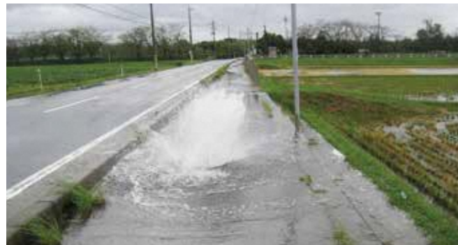
▲マンホールから汚水があふれる様子

ふたが開いたままになっていないか確認してください。ふたに穴があいているなど破損している場合は、交換してください。