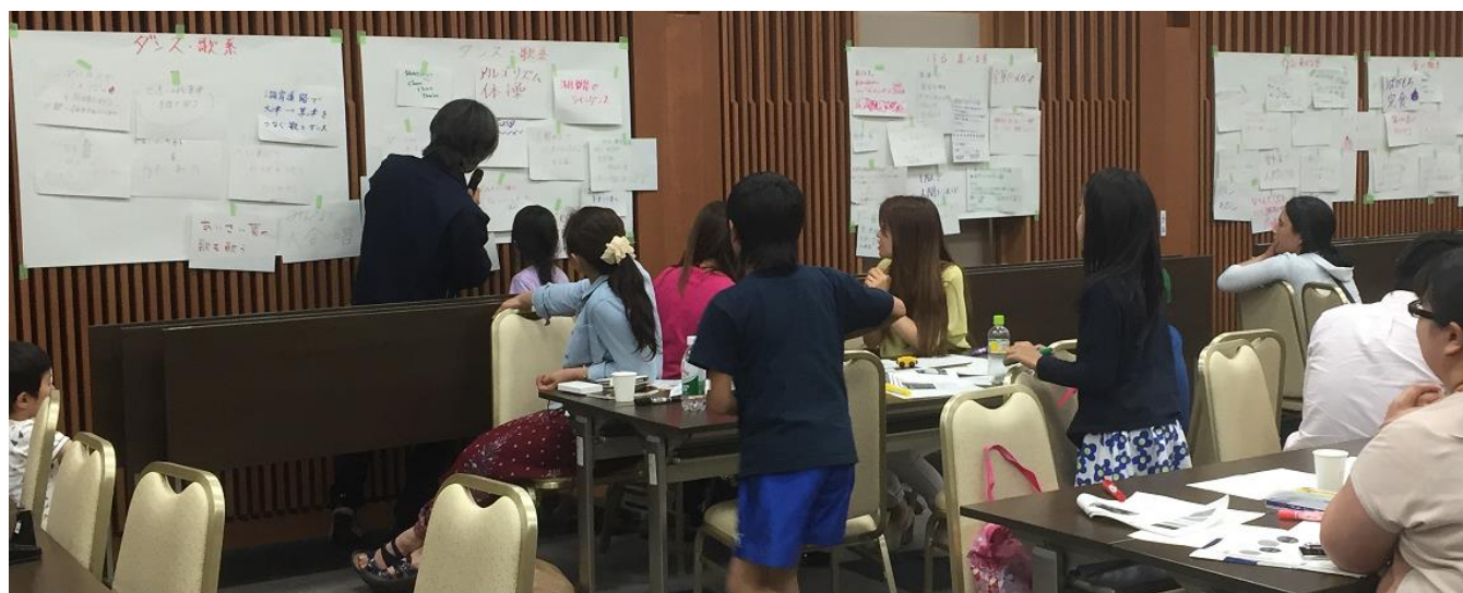
写真5. 提案していただいた内容を紹介