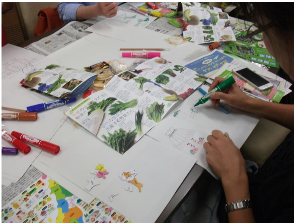
写真2. 資料を参考にデザイン