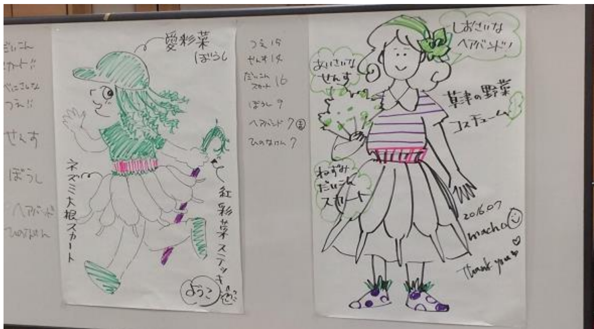
写真6. まちよさんの作品 (右)、山口さんの作品 (左)