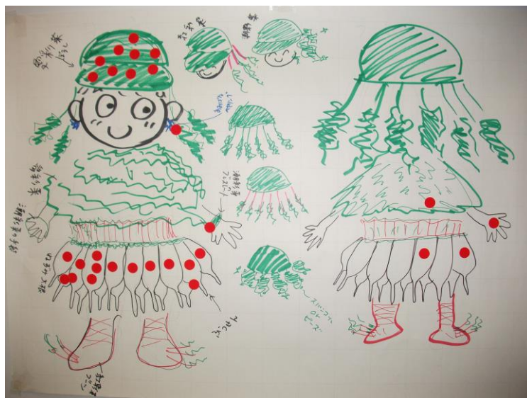
写真3. グループのデザイン (1)

各グループからデザインのポイントなどを発表いただいたあと、投票を行い、それぞれのグループのデザインのいいところを組み合わせ、まちょさんと山口さんにデザインしていただきました。