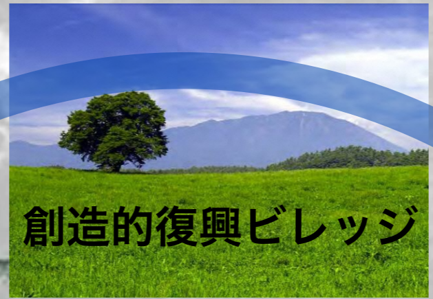
創造的復興ビレッジ