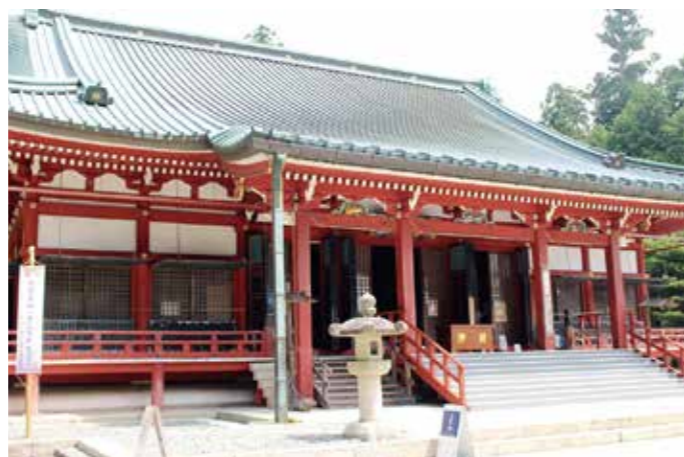
世界遺産に登録された比叡山延暦寺 (大津市)