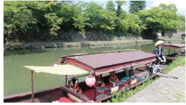
八幡堀 (近江八幡市)