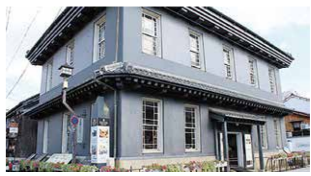
黒壁スクエア (長浜市)

世界遺産 世界中の人たちの宝物として、世界のみんなで協力して守っていく必要のある貴重な文化財や自然のこと。国連教育科学文化機関 (ユネスコ) で審議され、登録されます。