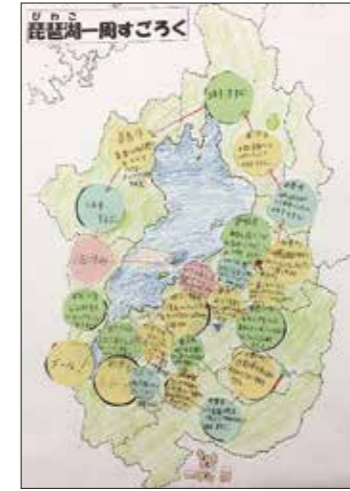
琵琶湖一周すごろく