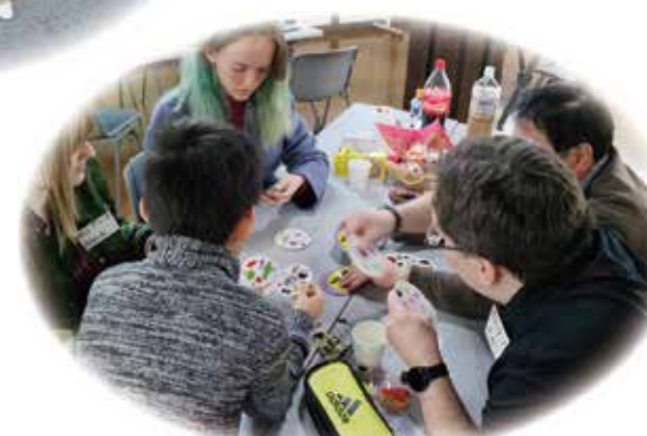
イングリッシュカフェの様子

どの国の人にも、いごちのよい滋賀県になるためには、どのようなことが大切か話し合おう。