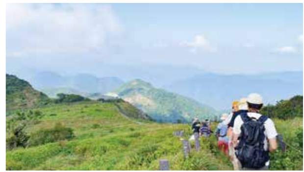
夏の伊吹山 (米原市)