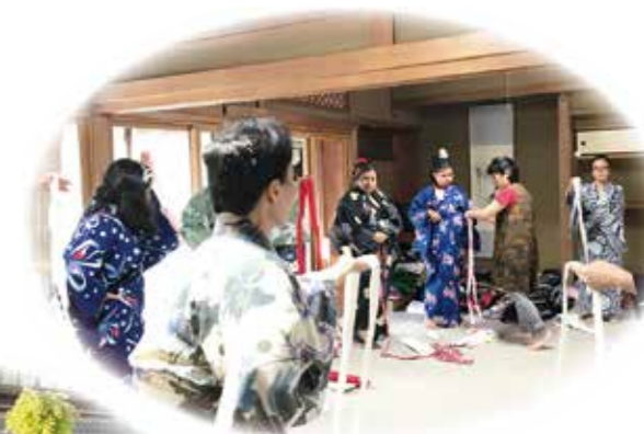
着物の着付け体験