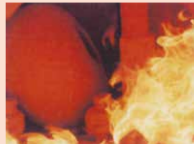
5 かまにつめ 1200~1300℃で焼く。