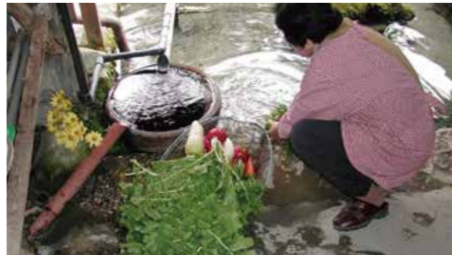
自然のわき水を生かしたくらし (高島市針江生水の郷)