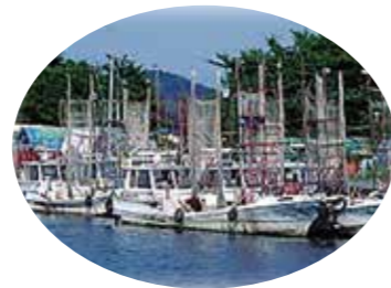
沖島 小アユ漁の漁船 (近江八幡市)

その土地の自然をいかして、どのような生活がされているのでしょうか。たずねてみたい市や町を調べてみましょう。