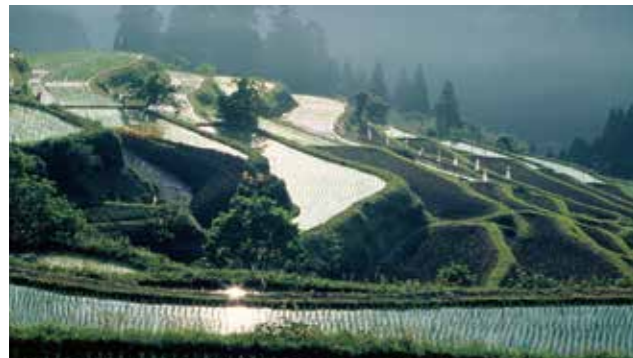
山のしゃ面を生かした棚田 (高島市)