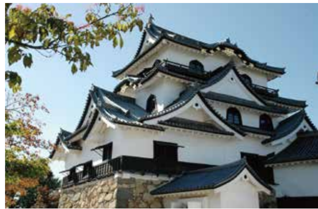
世界遺産の登録をめざす彦根城 (彦根市)

世界遺産 世界中の人たちの宝物として、世界のみんなで協力して守っていく必要のある貴重な文化財や自然のこと。国連教育科学文化機関 (ユネスコ) で審議され、登録されます。