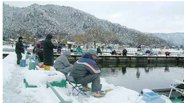
余呉湖でわかさぎつりを楽しむ人たち (長浜市余呉湖)

しが 滋賀県には、雪が多くふる地いきや、山が多い地いきがあります。また、日本でただ一つ湖の中にある人が住んでいる島であるおきしまなど、自然を生かした生活を送っているまちがあります。どんな工夫があるでしょう。