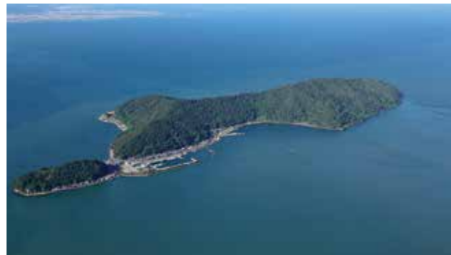
人が住む島 沖島 (近江八幡市)