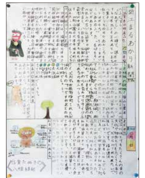
グループで作成した壁新聞