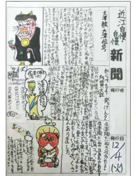
個人で作成した新聞

滋賀県のことを楽しく知ってもらうために、カルタやびわ湖一周すごろくなど、工夫してまとめましょう。