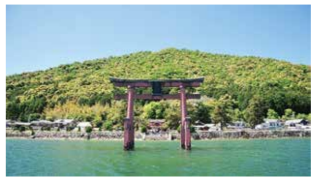
白ひげ神社 (高島市)