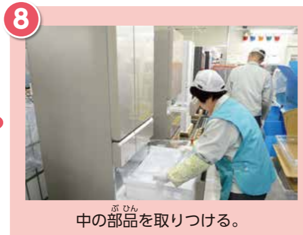
中の部品を取りつける。