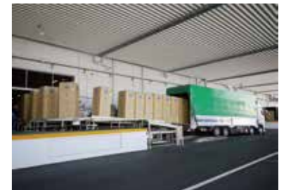
トラックに積みこまれる冷 れい ぞう庫 こ

トラックに積みこまれた冷 れい ぞう庫 こ は、どこに送 おく られるのでしょうか。