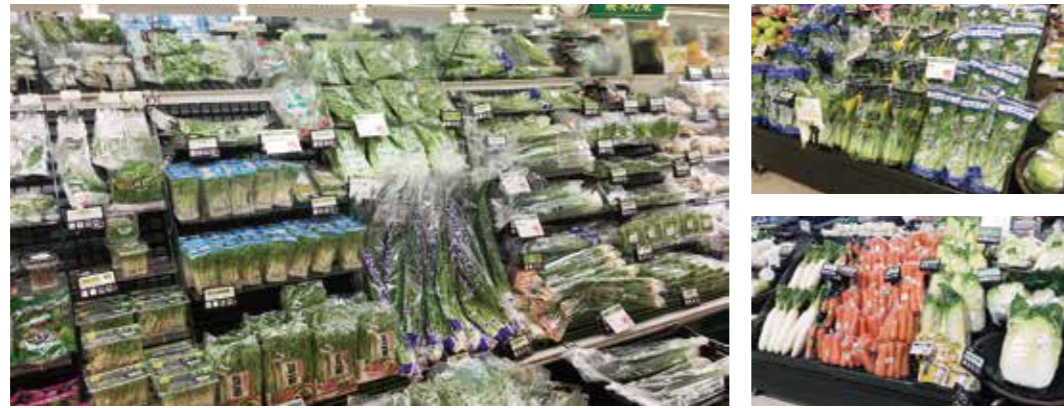
スーパーマーケットの野菜売り場

くさつ 草津市ではたらく人びとの仕事は、わたしたちのくらしとどの しごと ようにつながっているのでしょうか。仕事をしているところをた しら ずねて、調べてみましょう。