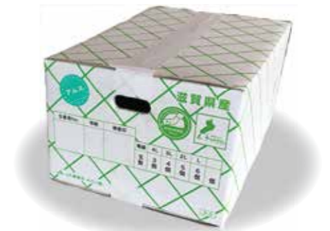
草津メロンを入れる箱