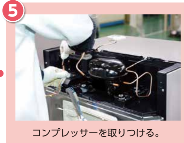
コンプレッサーを取りつける。