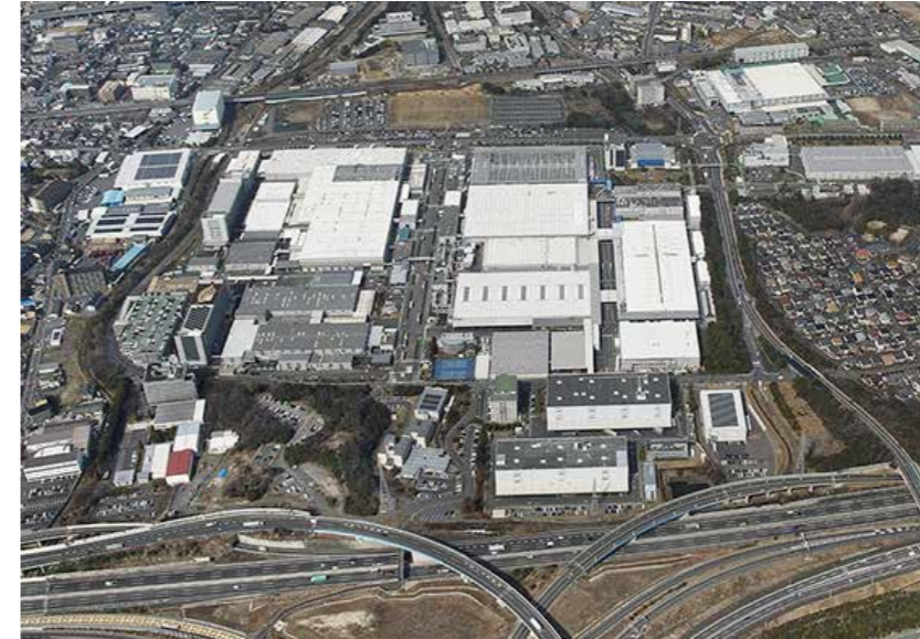
パナソニックの工場と、そのまわりの様子

草津市の南の方へ行くと大きな工場があります。先生が「みんなの家にもあり、生活にはかかせない冷ぞう庫をつくっている工場だよ。」と教えてくださいました。わたしたちは、家にある冷ぞう庫がどのようにしてつくられているのかを知りたくなりました。そこで調べてみたいことをみんなで話し合いました。