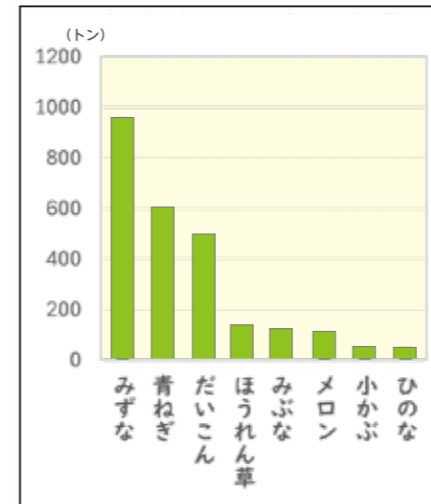
草津市の野菜生産量 (2022年実績 滋賀県農業経営課資料)

そこで、草津市では農家の 方々によってどんな野菜がど れくらい多く作られているか を調べてみることにしました。