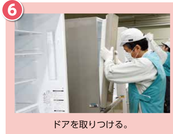
ドアを取りつける。