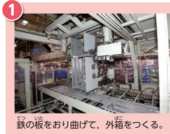
鉄の板をおり曲げて、外箱をつくる。