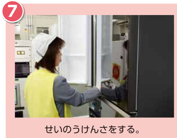
せいのうけんさをする。