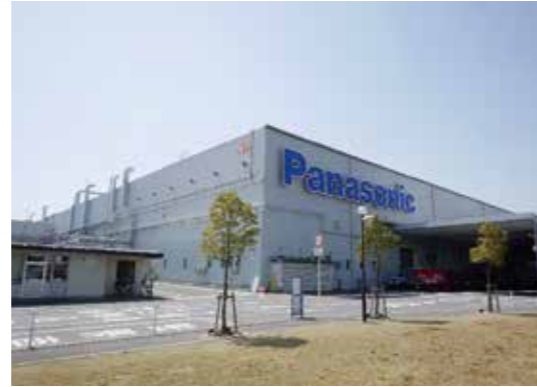
パナソニック冷ぞう庫工場

「草津市の様子」で学習したことを思い出して、自分たちのすむ草津市にどんな工場があるのかをみんなで話し合おう。また、となりのページの写真を見て、気づいたことを話し合おう。