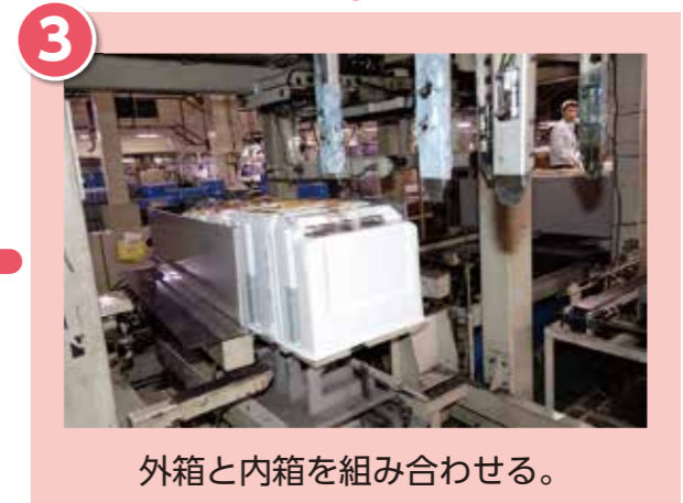
外箱と内箱を組み合わせる。