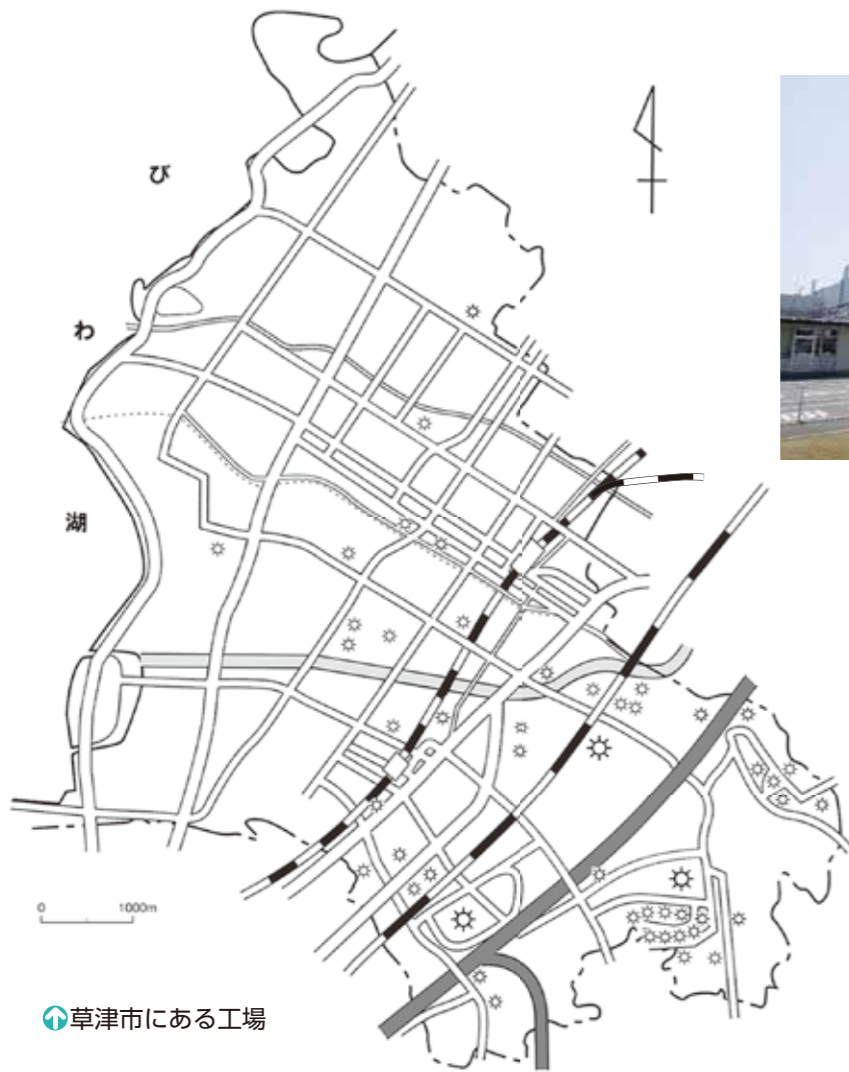
草津市にある工場