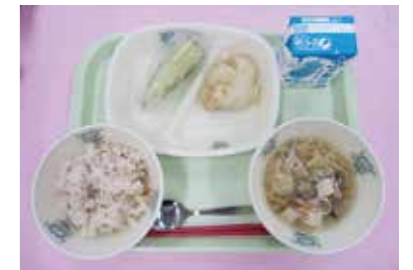
給食についての草津メロン