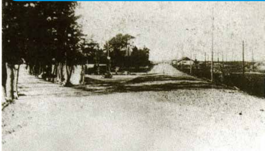
↑1935(昭和10)年ごろの様子

草津市 くさつ の様子や人びとのくらしの様子は、どのようにうつりかわってきたのでしょうか。写真や資料 しりょう をもとに気づいたことを話し合ってみましょう。