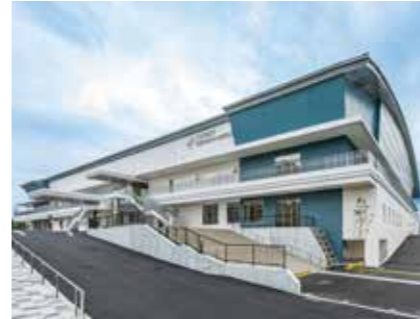
草津市立プール インフロント草津アクアティクスセンター

そこで、今まで学習してきた市や暮らしのうつりかわりを年表にまとめることにしました。