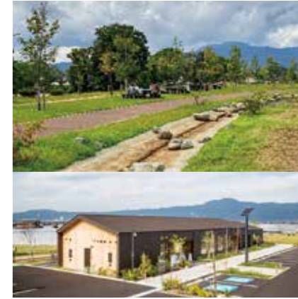
草津川跡地公園 ai彩ひろば