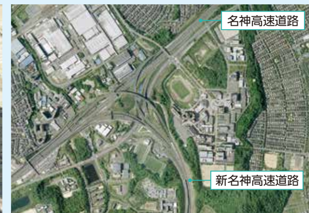
名神高速道路付近(2008年ごろ)