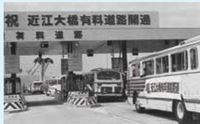
近江大橋の開通(1974年)