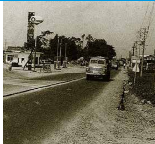
↑1963(昭和38)年ごろの様子