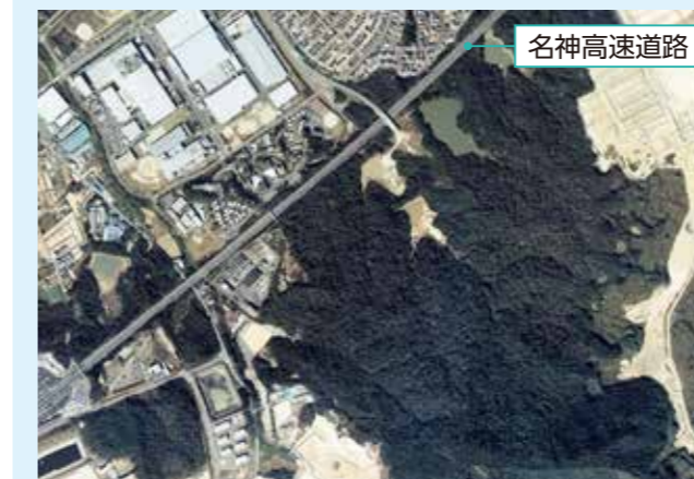
名神高速道路付近(1988年ごろ)