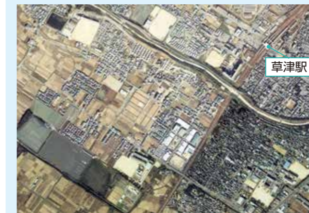
JR草津駅付近(1988年ごろ)