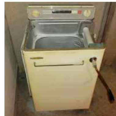
ローラー式洗濯機

調べていくうちに、せんたくで使う道具がだんだんかわっていることに気がつきました。