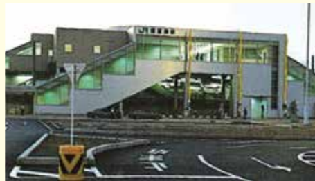
開業したJR南草津駅(1994年)