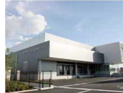
第二学校給食センター