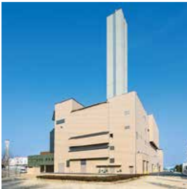
新しいグリーンセンター

草津市の公共しせつの写真や場所の地図が15, 16ページにのっているよ。見てみよう。