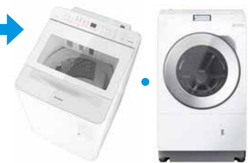
全自動洗濯機(たて型) 全自動洗濯機(ドラム式)