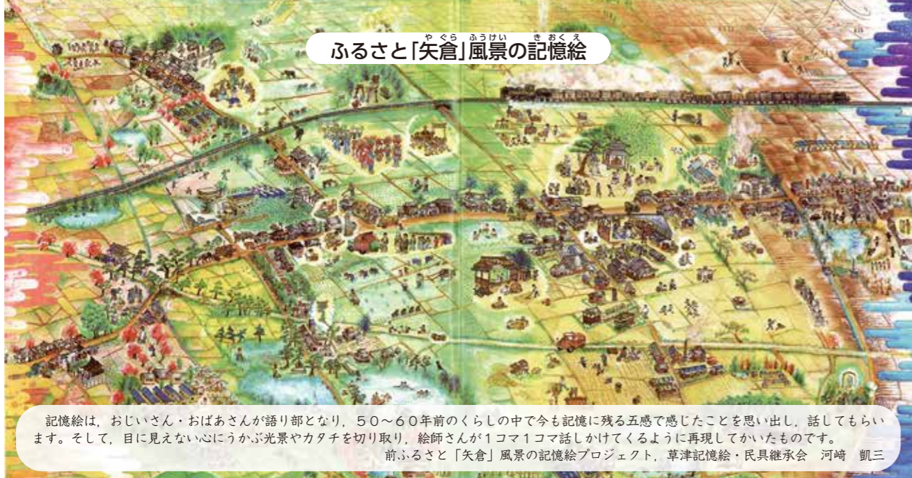
ふるさと「矢倉」風景の記憶絵

記憶絵は、おじいさん・おばあさんが語り部となり、50～60年前の暮らしの中で今も記憶に残る五感で感じたことを思い出し、話してもらいます。そして、目に見えない心にかが光景やカタチを切り取り、絵師さんが1コマ1コマ話しかけてくるように再現してかいたものです。 前ふるさと「矢倉」風景の記憶絵プロジェクト、草津記憶絵・民具継承会 河崎 凱三