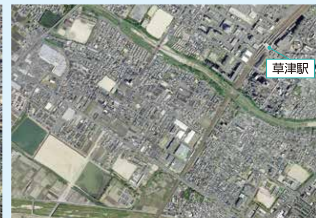
JR草津駅付近(2008年ごろ)