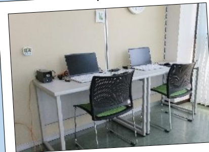
パソコンを使った学習

〈曜日〉 月・水・木・金曜日 (火曜日は学校登校日です) 〈時間〉 9:30～15:00 (金曜日は14:00まで)