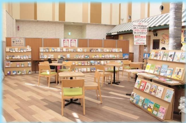
※写真は過去の本の交換会の様子です。