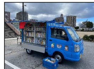
移動図書館「あおばな号」

約1,000冊の本と職員を乗せた自動車です。市内の小学校およびまびこ教室へ月1回を目安に巡回して、図書館サービスを提供します。