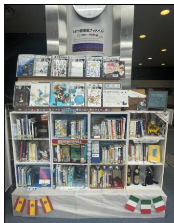
読書週間特別企画 司書の一箱選書 「くさつ図書館ブックバル」