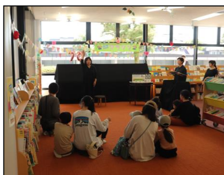
草津市市制施行70周年記念 「絵本マラソン」