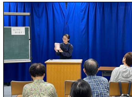
ブックトークの会