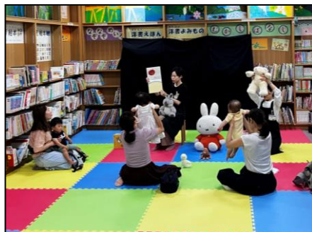
木曜おはなしのじかん