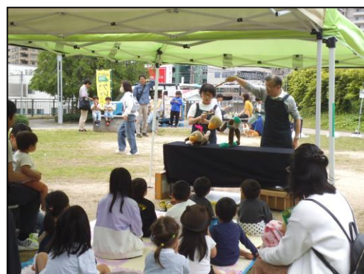
MINAKUSA こだわりマルシェ