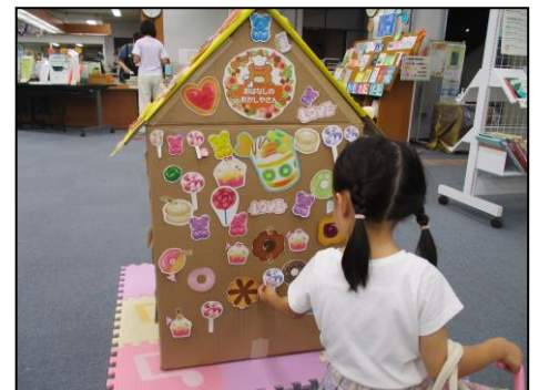
児童企画「おはなしのおかしやさん」