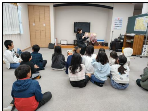
こども食堂楽しい放課後心おはなし会