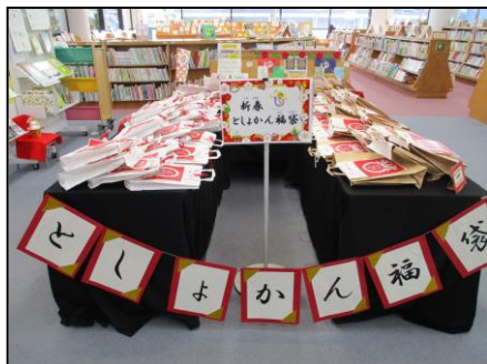
新春としょかん福袋