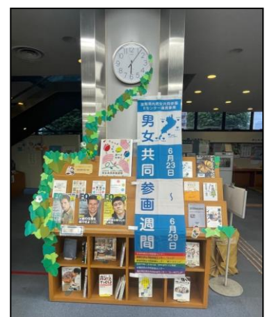
「男女共同参画週間」展示（他課連携）