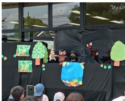
あおぞら図書館ミニ人形劇