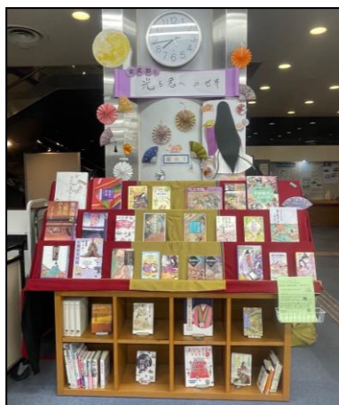
「紫式部と光る君への世界」展示